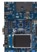
STM32G081B-EVAL STM32G0C1E-EV 評価ボード