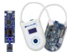
STM32G0316-DISCO / STM32G071B-DISCO (USB Type-C™) ディスカバリーキット